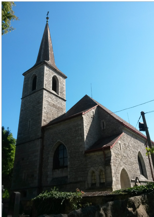
Kostel Nanebevzetí Panny Marie v Mukařově.

ná okna Nanebevzetí Panny Marie a Svatý Jan Křtitel v presbytáři, která kostelu daroval kníže Jan II. z Lichtensteinu.