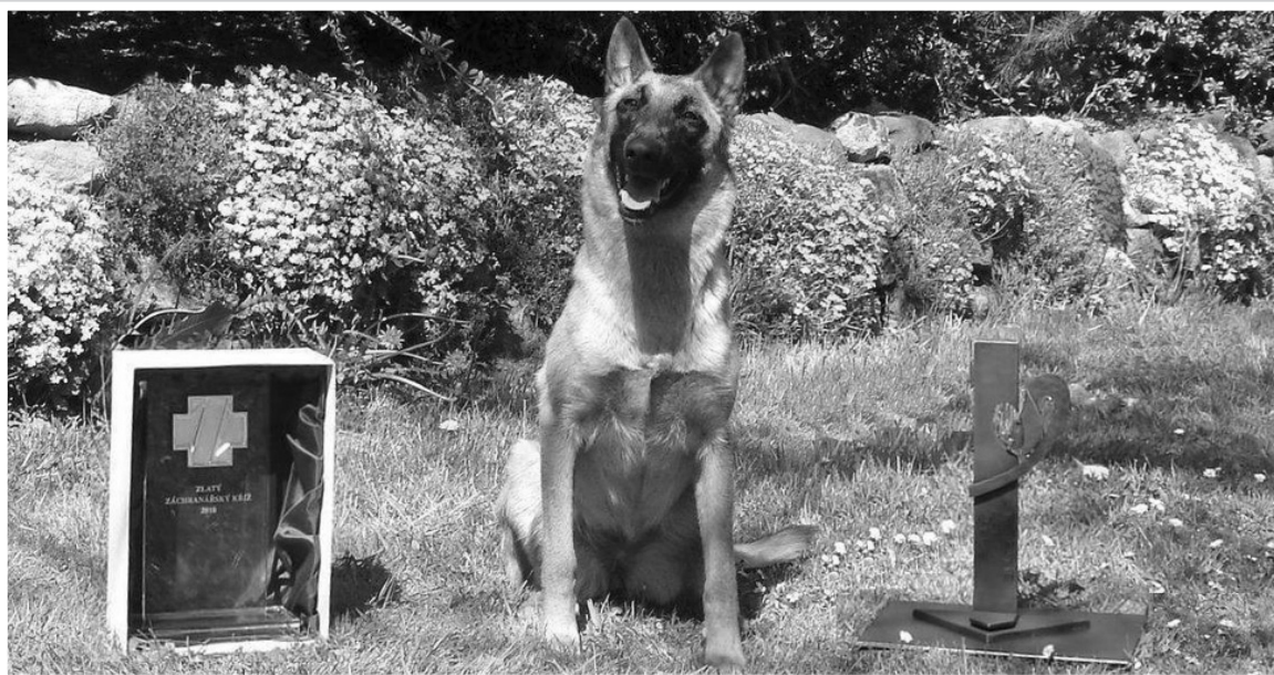
ARVEN, LOUŇOVICKÝ HRDINA, O KTERÉM SE DOČTETE UVNITŘ ZPRAVODAJE